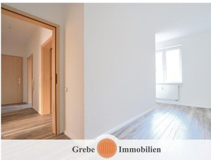
Flur / Arbeitszimmer