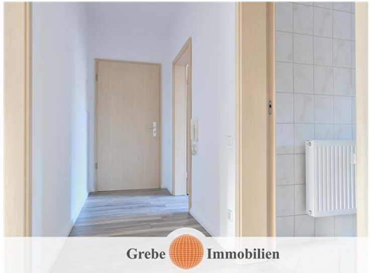
Blick in den Flur